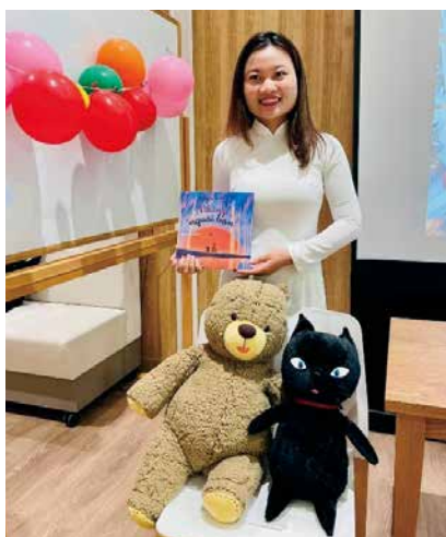
ベトナムの絵本読み聞かせにて。 素敵なストーリーに感動しました。