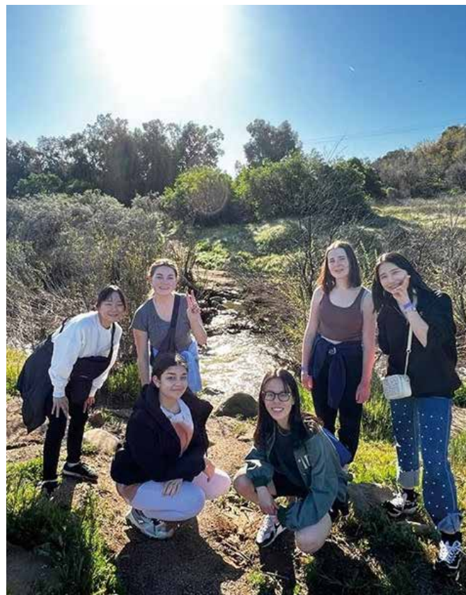
アメリカ・サンタクラリタ市