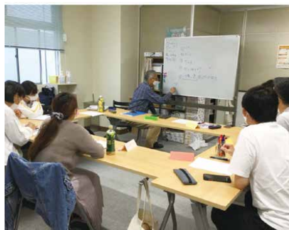
「このお休みに何をしましたか？」