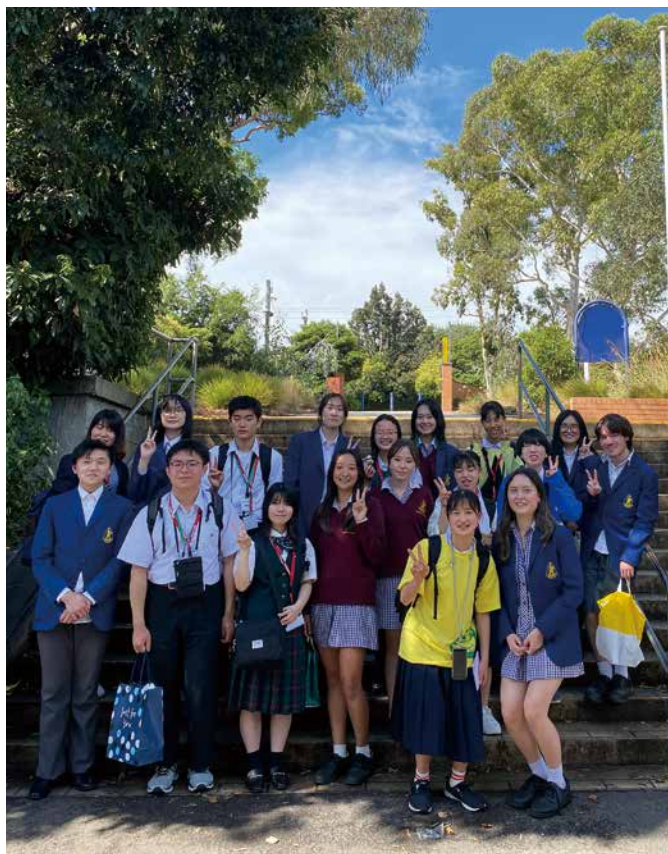
オーストラリア・ホワイトホース市

編集発行 (公財)松戸市国際交流協会 〒271-0092 松戸市松戸1307-1 松戸ビルディング4階(松戸市文化ホール内) ☎047-711-9511 FAX 047-308-6789 URL : https://www.miea.or.jp/ E-mail office@miea.or.jp